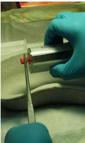
Abb. 4: Benutzung einer Pinzette als Abstandshalter

Bei der Präparation und bei der Applikation lässt sich die Strahlenexposition auch durch die Auswahl geeigneter Therapiespritzen beeinflussen. Es wird empfohlen, ausschließlich Perfusorspritzen zu benutzen, auch bei manueller Applikation. Diese Spritzen erleichtern wegen der guten Gleitfähigkeit des Kolbens das Aufziehen und Injizieren der hochviskosen Lösung und verringern so die Kontaktzeit und damit die Hautdosis. Zusätzlich besitzen Perfusorspritzen eine höhere Dichtheit gegen retrograden Aktivitätsaustritt und bieten daher besseren Schutz vor Kontaminationen.