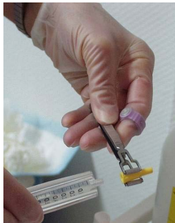
Abb. 5: Gebrauch einer Spezialpinzette und des amtlichen Fingerring- dosimeters