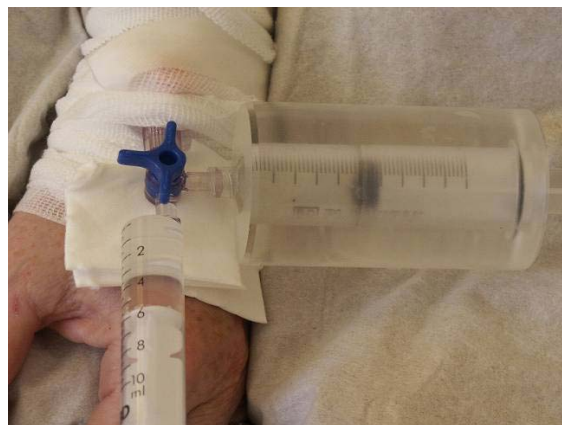
Abb. 9 Injektion über Dreiwegehahn (Spritzenabschirmung Eigenbau)