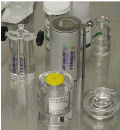
Abb. 1: Abschirmungen aus Acrylglas (Herst.: Biodex, Vertrieb: CIS Bio)

Von herausragender Bedeutung für die Reduzierung von Strahlenexpositionen des Personals ist die konsequente Verwendung der empfohlenen Abschirmungen für Spritzen, Aktivitätsfläschchen und das Reaktionsgefäß (Abb. 1). Beim Entnehmen von Aktivität ist darauf zu achten, dass die Abschirmung durch den mit einer Bohrung versehenen Deckel geschlossen ist. Anschließend sollte die Bohrung mit dem zugehörigen Acrylstopfen verschlossen werden. Analoges gilt für das Reaktionsgefäß.