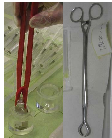
Abb. 3: Greifer und Zange für Fläschchen

Spritzenabschirmungen sollten grundsätzlich vom Aufziehen bis zur Entsorgung auf den Spritzen verbleiben, auch während der Durchführung von Aktivitätsmessungen. Die Dosisleistung an einer mit 1 GBq ^{90}\text{Y} gefüllten unabgeschirmten 5 ml-Spritze beträgt 43500 mSv/h (12 mSv/s, vgl. Tab. 1). Mit Spritzenabschirmungen, wie den in Abb. 2 gezeigten, lässt sich dieser Wert auf wenige mSv/h reduzieren. Auf deren Benutzung darf daher keinesfalls verzichtet werden.