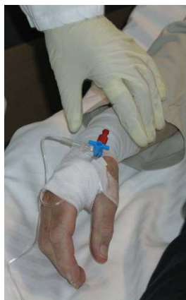
Abb. 7: Infusion mit Perfusor- pumpe über Schläuche

Eine weitere Möglichkeit zur Verringerung der Kontaktzeiten mit der ^{90}\text{Y} -Lösung und damit der Strahlenexposition besteht in der Optimierung der Arbeitsorganisation und der Vorbereitung des Arbeitsplatzes in Verbindung mit einem ausreichenden (inaktiven) Training der Arbeitsschritte.