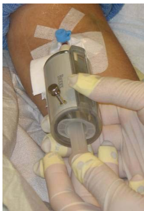
Abb. 8: Direkte Injektion in Braunüle